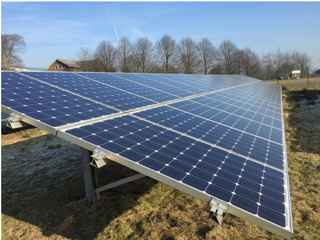
Bild 2: Beispiel einer PV-Freiflächenanlage mit 2 senkrechten Modulreihen